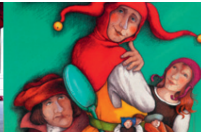
© I. u. z.: Karlhans Frank/Renate Seelig, Eulenspiegel Museum, Mölln