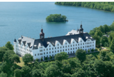
L.u.z.: © Fielmann Akademie