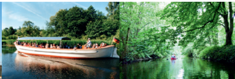
v.l.n.r.: © Hendrik Kühl Schwentinerfahrt; © Preek Stadtmarketing

*Schleswig-Holstein-Ticket gilt nicht im Bus