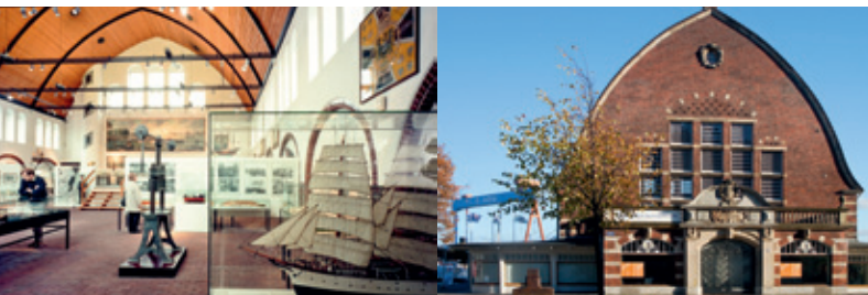
v.l.n.r.: © Kieler Stadtmuseum/Renard; © Kieler Stadtmuseum/Dagge