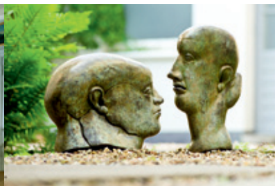
L.u.z.: © Michael Haydn