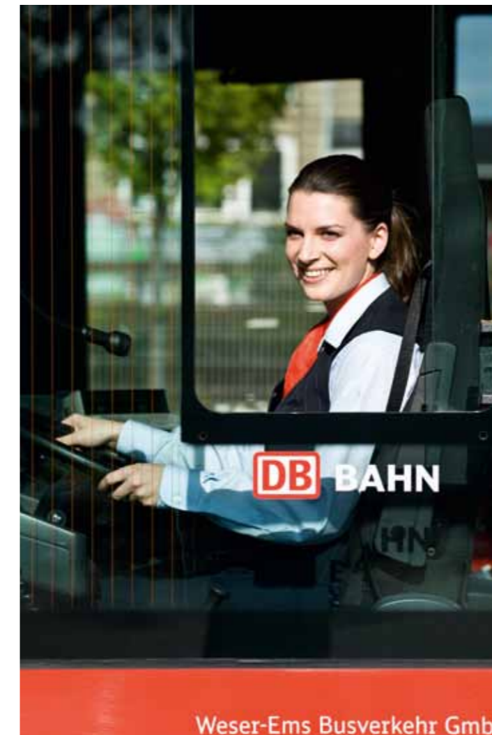
Weser-Ems Busverkehr GmbH